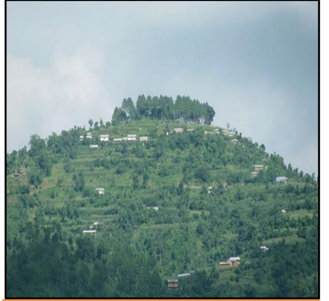
फोटो १.९ उलुक छत्रमहाराजको मन्दिर परिसर