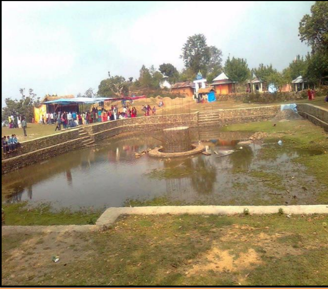
फोटो १.६ पाणिनी तपोभूमी