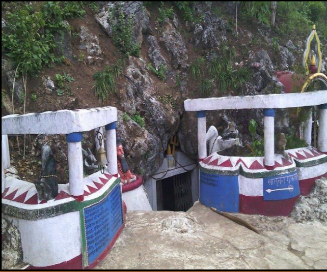
फोटो १.७ दुर्वाशेश्वर गुफा