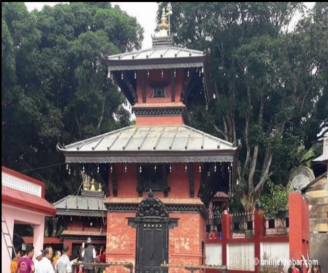
फोटो १.८ सिद्धेश्वर शिवालय मन्दिर