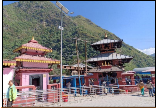
फोटो १.२ सुपा देउराली मन्दिर