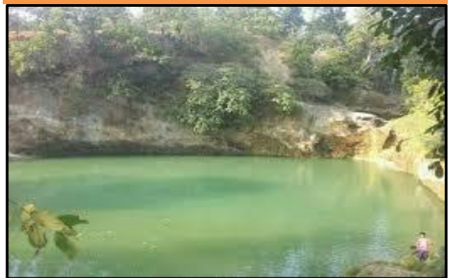
फोटो १.४ बराह दह