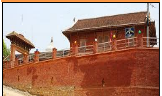
फोटो १.५ छत्रदेव महाराजको मन्दिर