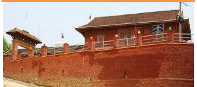
फोटो १.५ छत्रदेव महाराजको मन्दिर