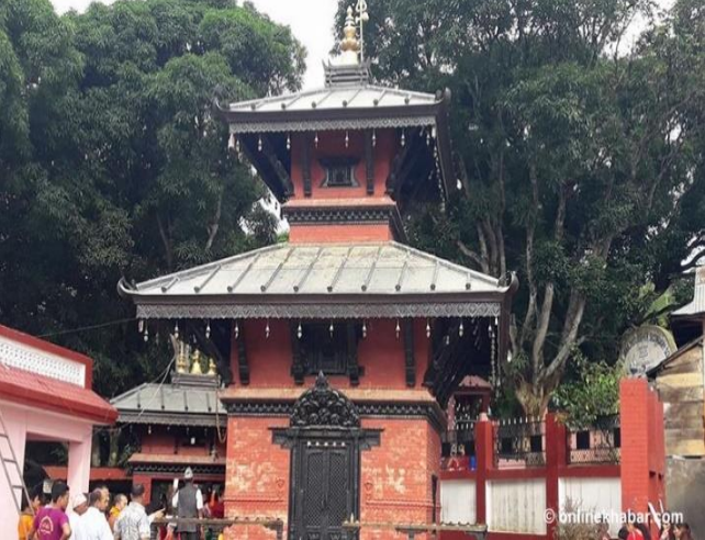
फोटो १.८ सिद्धेश्वर शिवालय मन्दिर