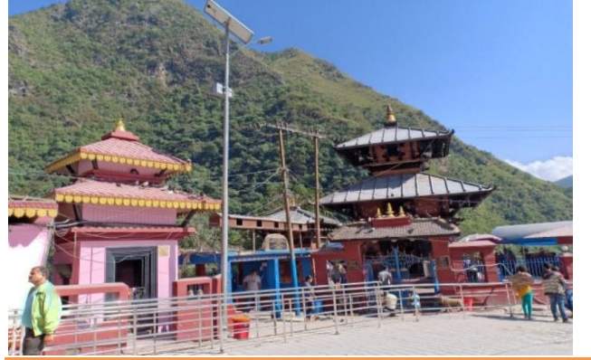
फोटो १.२ सुपा देउराली मन्दिर