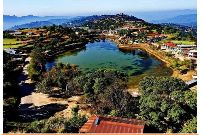
फोटो १.३ डमरु दह