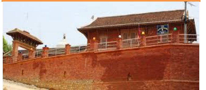
फोटो १.५ छत्रदेव महाराजको मन्दिर