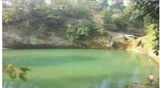
फोटो १.४ बराह दह