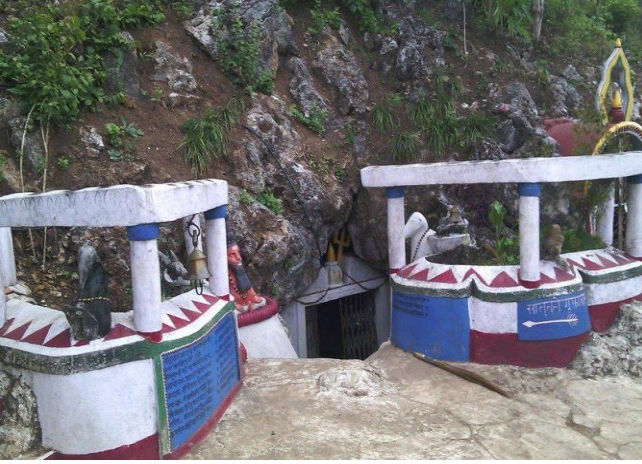
फोटो १.७ दुर्वाशेश्वर गुफा