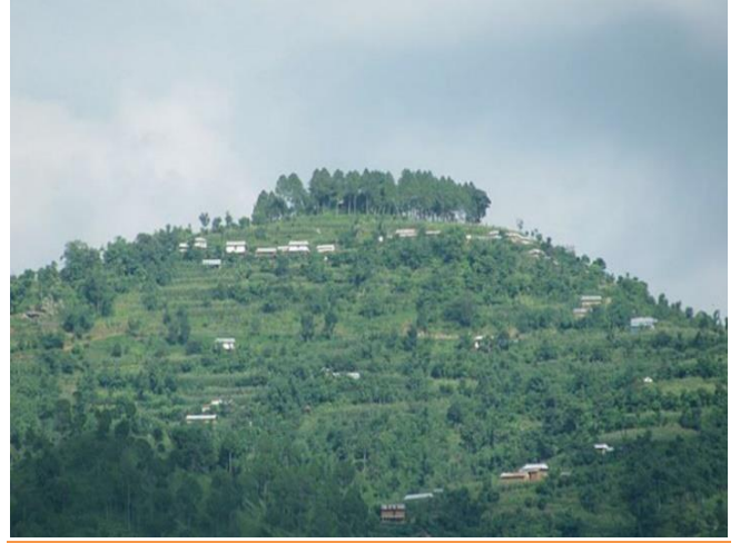
फोटो १.९ उलुक छत्रमहाराजको मन्दिर परिसर