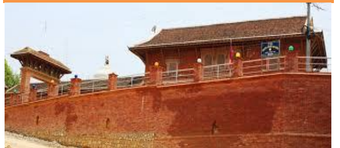
फोटो १.५ छत्रदेव महाराजको मन्दिर