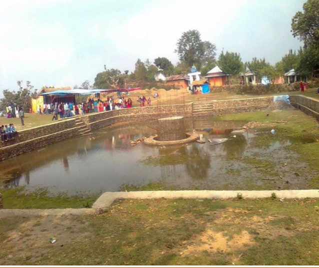
फोटो १.६ पाणिनी तपोभूमी