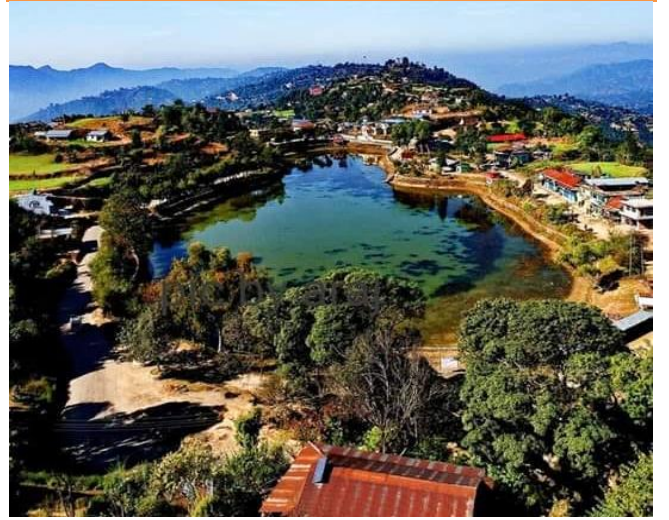
फोटो १.३ डमरू दह