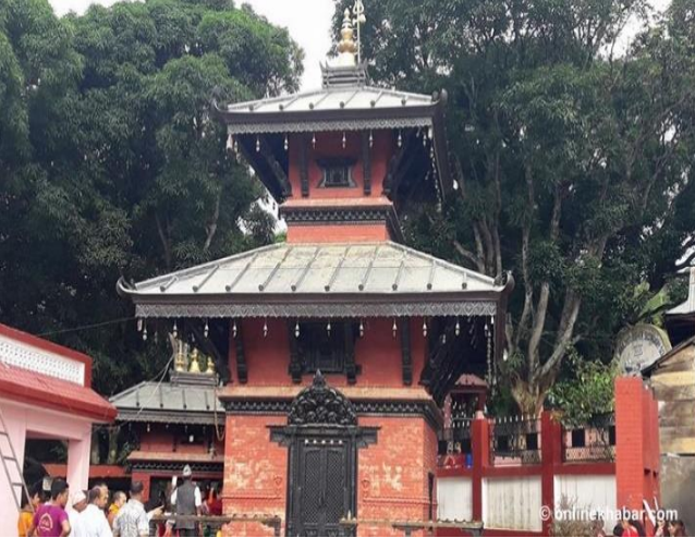
फोटो १.८ सिद्धेश्वर शिवालय मन्दिर