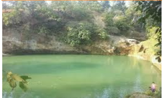
फोटो १.४ बराह दह