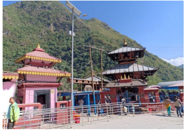
फोटो १.२ सुपा देउराली मन्दिर